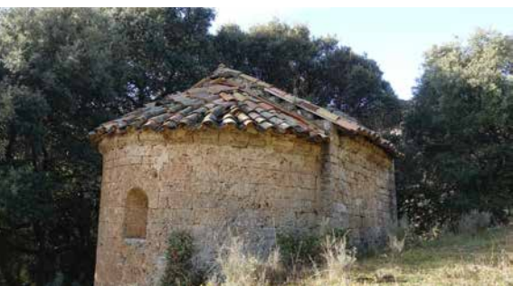
MHÀ, ESTUDI GRÀFIC · DL: L 98-2021 · FOTOGRAFIES. PORTADA: salines de Cambrils (arxiu Aj. d'Odèn). CONTRAPORTADA: el Racó (arxiu Aj. d'Odèn); Sant Quintí (Marcel Camps). INTERIOR: salt del Racó (arxiu Aj. d'Odèn); Santa Bàrbara (arxiu Aj. d'Odèn)