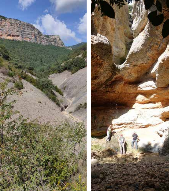
MHÀ, ESTUDI GRÀFIC - DL: L 90-2021 - FOTOGRAFIES. PORTADA: Canalda (Marcel Camps). CONTRAPORTADA: riera de Canalda (arxiu Aj. d'Odèn); torrent de la Perdiu (Marcel Camps). INTERIOR: Sant Julià de Canalda (Marcel Camps); devesa de can Prat (Marcel Camps)