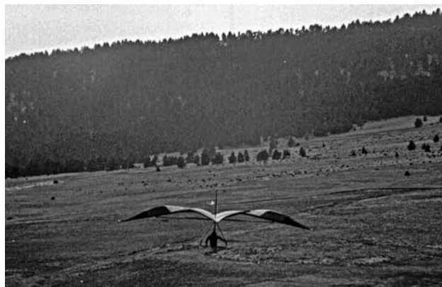
Volant per sobre dels prats de Bacies